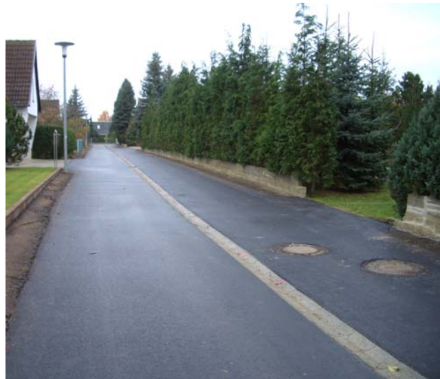
Erschließungsstraße AW1 Schnitt

Bearbeitungszeitraum: 2006 Bausumme: 90.000 EURO Auftraggeber: Amt Ortrand für die Gemeinde Tettau